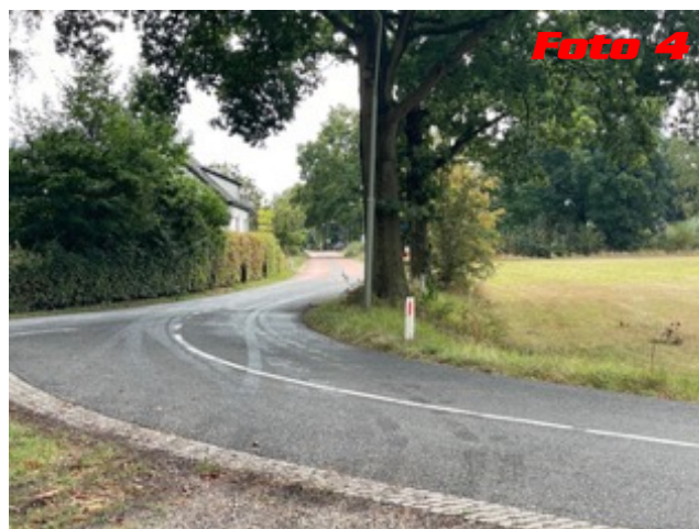
Foto 4 Int. 0,04 km Neem deze weg. Int. 0,02 mi