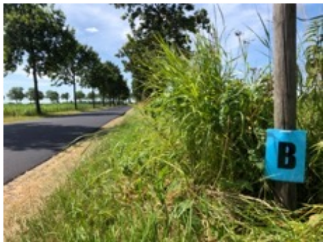
Letterbord (21x30 cm)

NB: Indien in de Rijdersbriefing andere borden zijn getoond, dient u de getoonde borden te volgen.