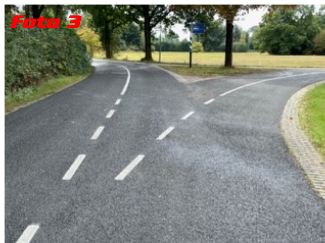
Foto 3 Int. 0,98 km Hou hier rechts aan. Int. 0,61 mi