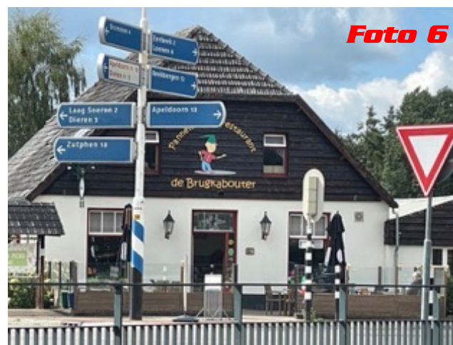
Foto 6 Int. 4,75km Ga richting de Brugkabouter en daarna richting Laag Soeren. Int. 2,95 mi