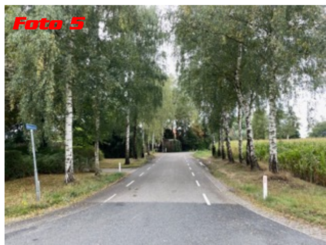
Foto 5 Int. 1,72 km Neem deze weg. Int. 1,07 mi HP: Rhienderensestraat.