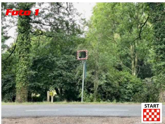
Foto 1 Int. - km Deze etappe start op de parkeerplaats van Landgoed Voorstonden. Rij naar de openbare weg en ga links af de openbare weg op. Int. - mi