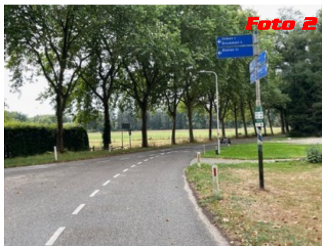
Foto 2 Int. 0,32 km Ga richting Oeken. Int. 0,20 mi