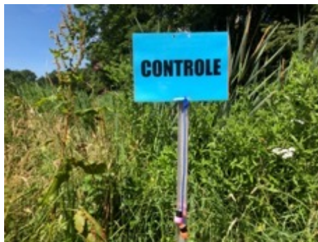
Controlepostbord met stempel (onbemand of bemand 21x30 cm)