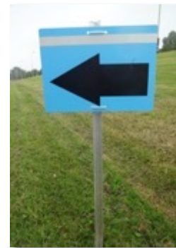
Omleidingsbord (prevaleert boven Routeboek, mogelijk met extra instructies, 21x30 cm)